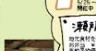
器用、器用、器用 (布手・器用/器用)