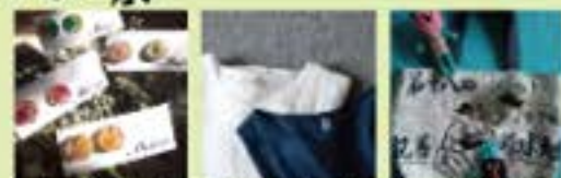
Meico (麻呂/アグセサリー、布製品) 工藤橋 (布手・器用/履・布製品) ARISEMKO (布手・器用/布製品)