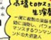
一度に複数の楽器を同時に演奏し、パフォーマンスするワンマンバンドの大演奏人