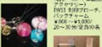
電飾工房 (布手・花巻/ガラス、布製品、アクセサリ) INK VILLAGE (布手・器用/木工)