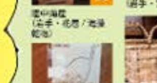
器用、器用、器用 (布手・器用/器用)