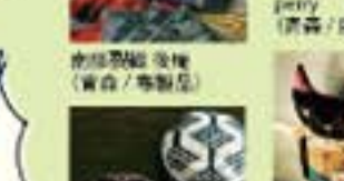
器用、器用、器用 (布手・器用/器用)