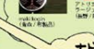
器用、器用、器用 (布手・器用/器用)