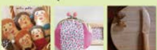
SamaBata (布手・器用/器用、布製品) 小さなおきな装飾品 (布手・器用/器用) K131 (器用/木工)