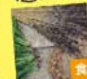
花月すまちゃん (布手・器用/器用、布製品)