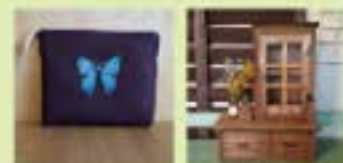
HANDMADE 布の (布手・器用/履・布製品) MH design (布手・器用/履・布製品)