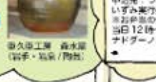
器用、器用、器用 (布手・器用/器用)