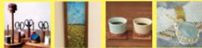
木工屋 (H&O) (布手・器用/木工) ガラスアート つら (器用/ガラス) うつわ工房 千の森 (器用/布製品) MILK COFFEE LANE Orbit (器用/器用、アクセサリ)