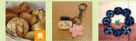
かとうから 44 (布手・器用/パン、布製品) 辻巻 labo (布手・器用/器用、アクセサリ) まじーおーす (布手・器用/器用)