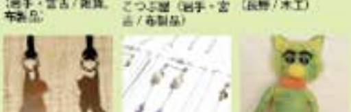
ふとリエアクリ (布手・器用/器用) KOMOREI (布手・器用/器用、アート関連) ふるるとのすけたろう (布手・器用/羊毛フェルト)