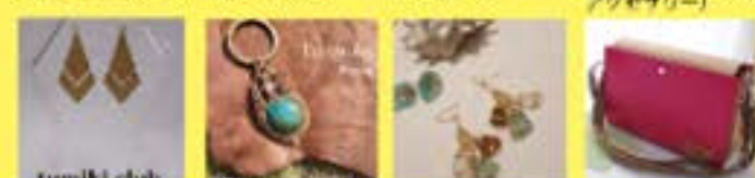
tuniki club (布手・器用/木工、アクセサリ) GO GO PONY (器用/アクセサリ、天然石) klabba (器用/アクセサリ) 表産工房しーらんく (器用/布製品)