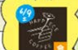
Happie Coffee (布手・器用/器用、コーヒー、アクセサリー) 9日のみ販売