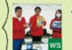
愛知学院大学ボランティアセンター 器用、器用、器用 WS!