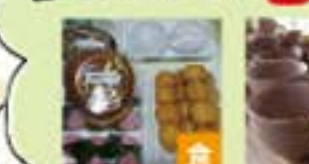
備が込め手のまん、しょうろさん (布手・器用/器用、まんじゅう、まんじゅう)