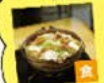
いらいずみ匠 水月モンブラン菓子 (布手・器用/器用)