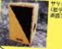
ササキ 44 (布手・器用/器用)