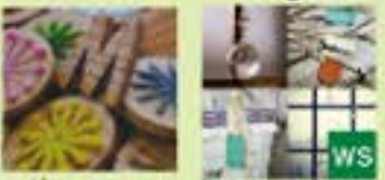
moska (布手・器用/木工) ありこときりん (布手・器用/布製品、アクセサリ)