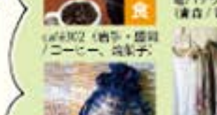
器用、器用、器用 (布手・器用/器用)